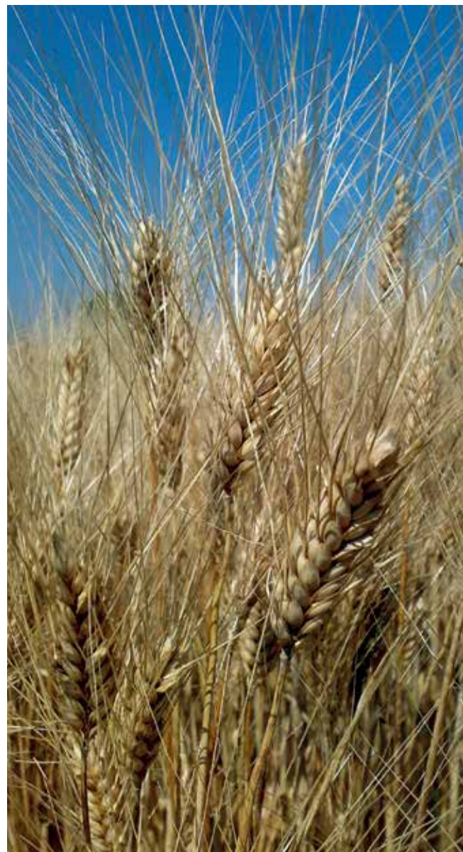
Tabella 4: Grano duro a Fiume Veneto nel 2016/17. In rosso le novità