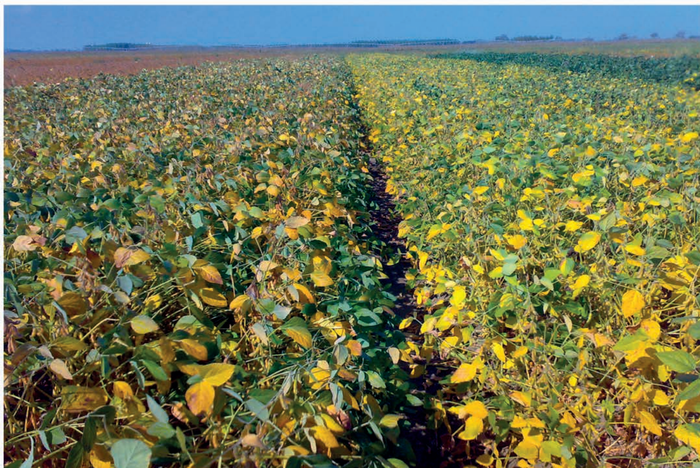
Foto 2: Mantenimento in purezza di nuove varietà di soia costituite da ERSA.

Nella Tabella 1 vengono riportati i risultati medi di due località, relativi alla produzione (in t/ha al 14% di umidità), l'indice di produttività (variazione percentuale della produttività della singola cultivar rispetto alla media generale), l'umidità del seme alla raccolta, l'altezza pianta, l'entità dell'allettamento alla raccolta, la data di maturazione e la fittezza. Il contenuto di proteine è relativo alla prova di Fiume Veneto. Le varietà sono ordinate secondo la produzione media e le ultime due colonne a destra riportano le rese ottenute nelle singole località. Per facilitare la lettura ed interpretazione, le varietà o gruppi di cultivar con medesimo colore non hanno una produttività significativamente diversa fra loro. Con il fondo verde sono segnalate le varietà più produttive seguite dal fondo giallo e via via diminuendo con i colori arancio e grigio. Quest'anno, in base a precedenti esperienze, ci è sembrato possibile mettere in prova, in un unico blocco, le varietà appartenenti ai diversi gruppi di maturità, senza peraltro avere ripercussioni o danni delle più