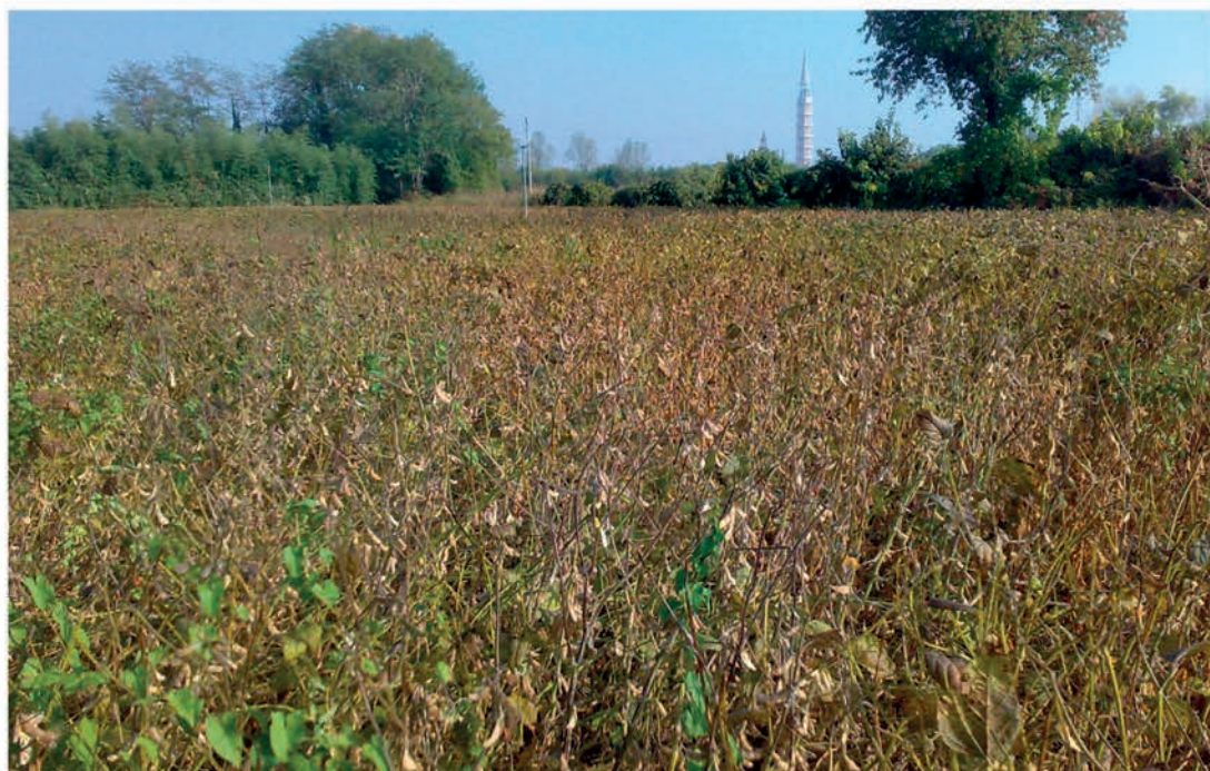
Foto 1: A Mortegliano le alte temperature hanno gravemente danneggiato la soia seminata i primi di maggio.

Ben 42 le varietà di soia in prova quest'anno con numerose novità: