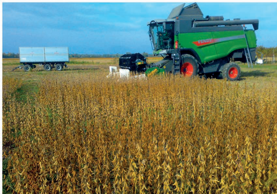
Foto 3: Operazioni di trebbiatura a Sedegliano, il 24 ottobre 2018.